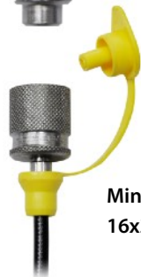
Minimes-Schlauch 16x2 (800 mm)